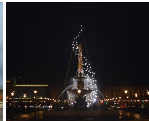
PHARES de jour et de nuit, place de la Concorde © Milène Guermont